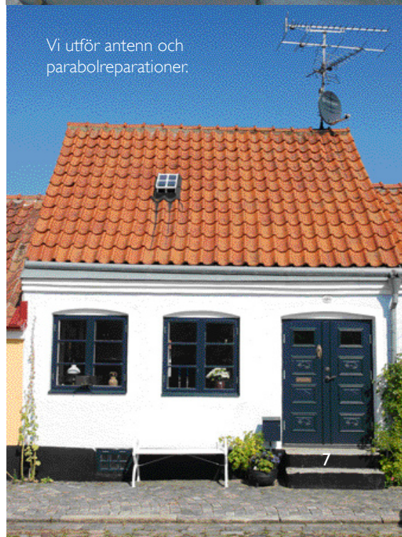
Vi utför antenn och parabolreparationer.