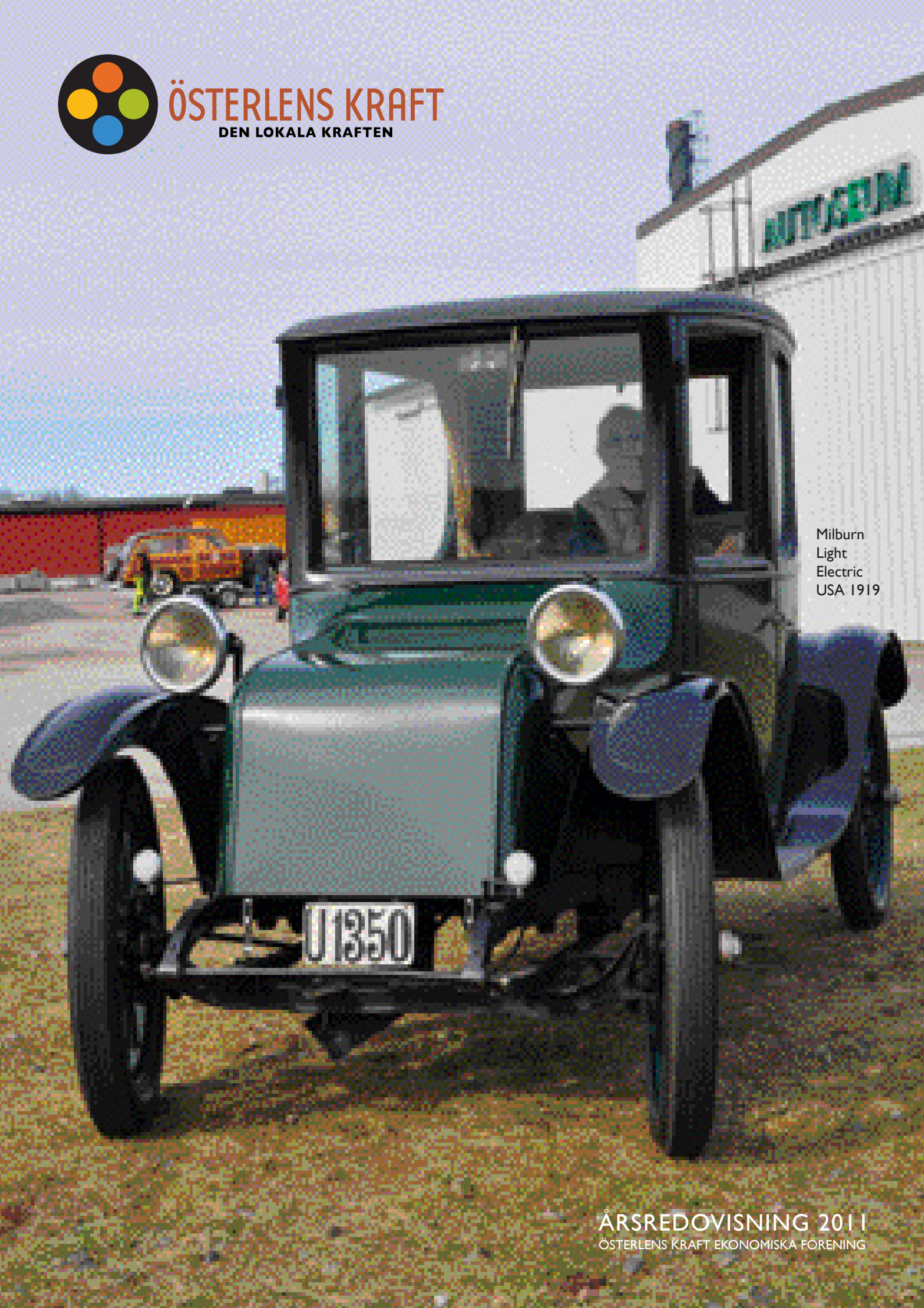
Milburn Light Electric USA 1919